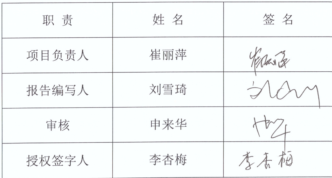
报告编写及审查人员职责表